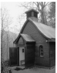
1935 gebaut, 1975 abgebrannt: Die Kapelle wurde erneut aufgebaut.