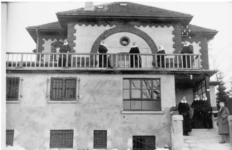
Haus Salem, 1934: Damals war es Erholungsstätte für Sarepta-Diakonissen.